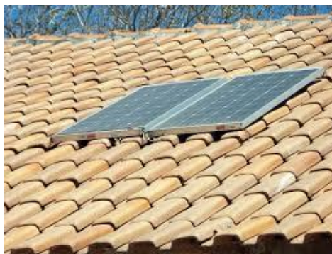
Figura 3 - Placa solar.

Quando a imagem for de própria autoria, não é necessário colocar “Fonte: o autor” ou algo semelhante. Deduz-se que, se não há fonte, a autoria é do próprio autor. Exemplo: